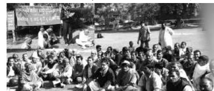
बिजली और शौचालयों का प्रबंध किये जाने की मांग की गई।

लेबर महकमे द्वारा मजदूरों तक पहुंच कर खुद रजिस्ट्रेशन सरल व बिना फीस के करने, चोट लगने पर मुफ्त इलाज व हर्जा खर्चा देने, मृत्यु होने पर 11 लाख रुपये मुआवजा देने, मजदूरी देने से इन्कार करने वालों के खिलाफ कारगर व सख्त कार्रवाई का कानून बनाने, ठेकेदारों की मनमानी पर रोक लगाने, ठेकेदारी प्रथा बंद करने, नरेगा के जॉब कार्ड बनाये जाने व 500 रु. दैनिक मजदूरी पर काम देने, हर जिला में सहायक निदेशक को क्लेम देने का प्रावधान होने, सभी के स्मार्ट कार्ड बनाने, सभी हितलाभों का भुगतान 1 महीने में करने, प्रवासी मजदूर कानून लागू करने, हर केन्द्रीय ट्रेड यूनियन के प्रतिनिधि को कल्याण बोर्ड में लिये जाने, हर गांव-शहर में सरकारी दुकान खोलकर जरूरी चीजें सस्ते रेट पर सभी परिवारों को देने, देहात में 100 गज व शहर में 60 गज के रियायशी प्लॉट देने, मकान बनाने के लिए 5 लाख रुपये अनुदान देने, लेबर चौकों पर सर्दी, गर्मी व बारिश से बचाव के लिए शैल्टर बनाने और इनमें साफ पेयजल,