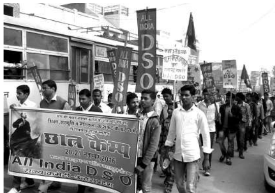
जौनपुर : छात्र कैम्प शुरू होने से पहले शैक्षणिक मांगों को लेकर प्रदर्शन करते हुए छात्र